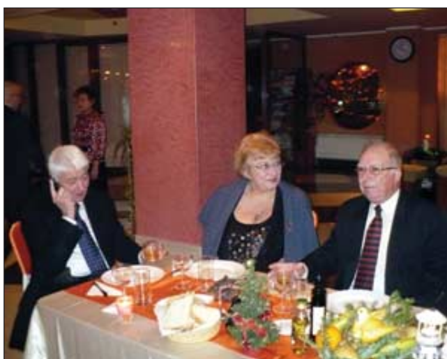
Amiralul Bone Stan sorbit din priviri de comeseana lui

Foarte repede după așezarea la locurile noastre, bossul Calipso a slobozit masa și preparatele culinare au început să vină pe bandă rulantă, iar băuturile să curgă în valuri, întocmai ca marea aflată la doar o sută de metri de noi. N-au lipsit mâncărurile românești tradiționale, începând cu piftia, și terminând cu sarmalele, dar nici salata de boeuf, icrele și grătar de pește. Ultimele, să se simtă că suntem pe litoral. Friptura de curcan nu ne-a mai încăput în stomacuri, așa că, în unanimitate, am amânat-o pentru a doua zi, când a fost servit pe muzică de fanfară, în pas de defilare, pe tăvi în flăcări. țuica a fost de fapt palincă, iar vinurile au fost