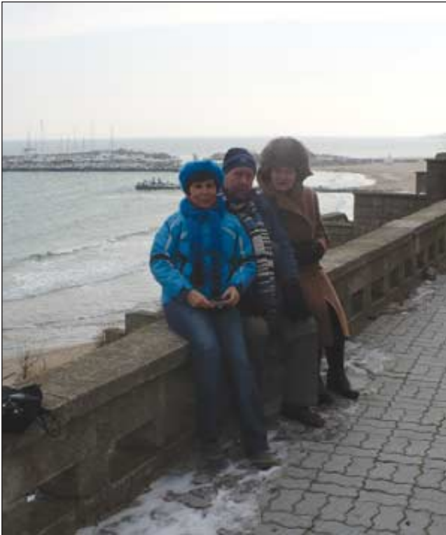
Zgribuliți, zgribuliți... Vântul intrase în scenă.