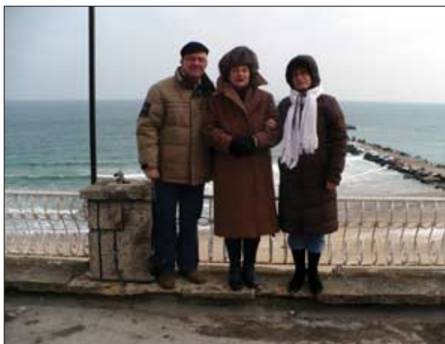
Pe doi ianuarie marea era cenușie și agitată. Pe cei din poză pare să nu-i impresioneze: i-au întors spatele.