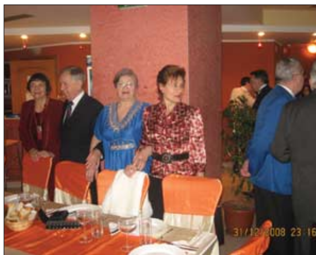
Aliniați pentru raport