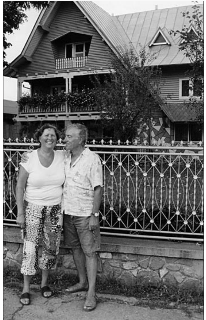
Soții Olaru, veniți din America pentru o cură de întinerire la Breaza