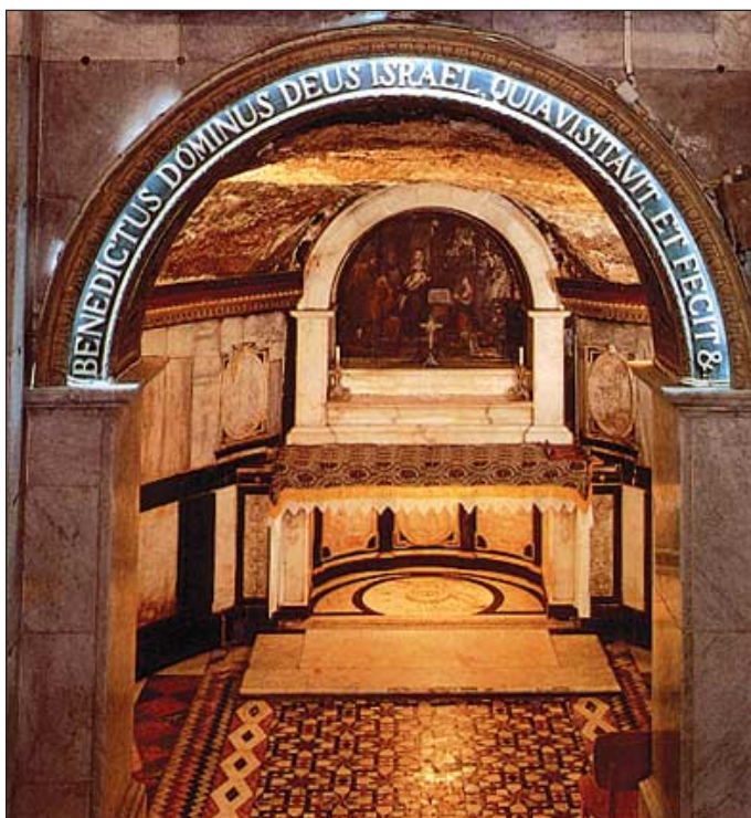
Locul nașterii Înaintemergătorului din Biserica Sf. Ioan Botezătorul

▲ Pe peretele încăperii, la intrare, am adus de acasă și l-am atârnat, un tablou al regretatului